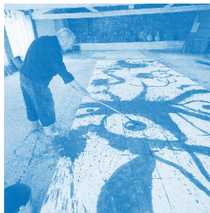
Joan Miró während seiner Arbeit an «Oiseaux qui s’envolent» in Gallifa, 1971 Foto: Francesc Català Roca, © Arxiu fotogràfica de Barcelona © Sucessió Miró / 2015 ProLitteris, Zürich

Seine breitformatigen, schmalen Bilder weisen auf seine grossen Bildkompositionen mit Keramikplatten hin. Das Keramikfries „Oiseaux qui s’envolent“, das Miró 1971/72 für das Kunsthaus realisierte, erhält durch diese besondere Untersuchung eine neue Beurteilung.