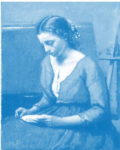
Camille Corot, Lesendes Mädchen , um 1845 /1850 Öl auf Leinwand, 42,5 x 32,5 cm Stiftung Sammlung E. G. Bührle, Zürich

Die Ausstellung vereint diese verschiedenen Wege der französischen Malerei zu einem vielfältigen Panorama.